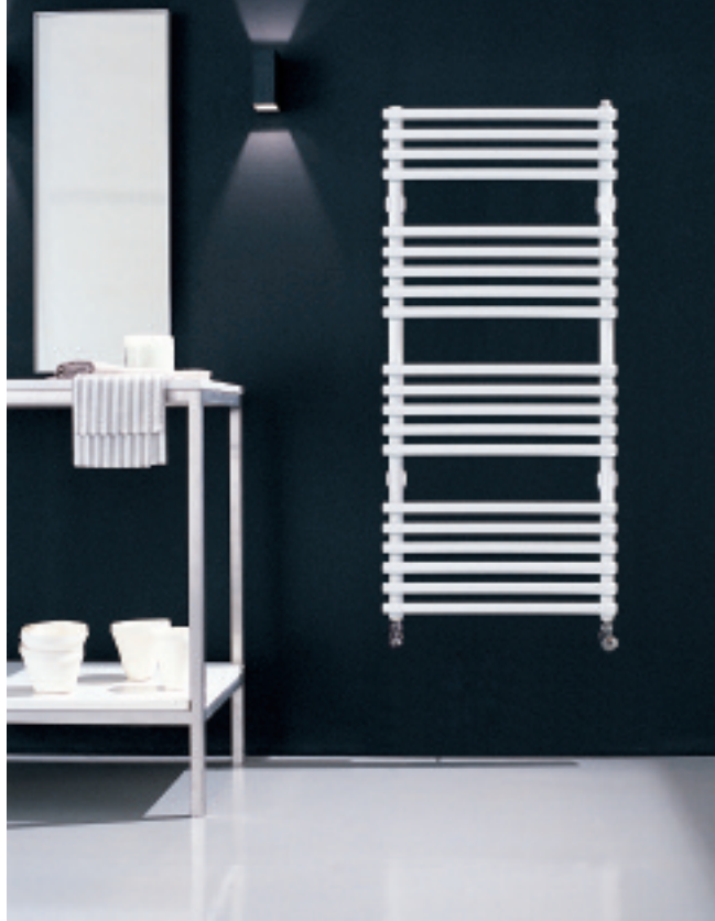
In foto: Radiatore Kart. Altezza mm 1112, larghezza mm 500, colore Bianco Standard (cod. 01).