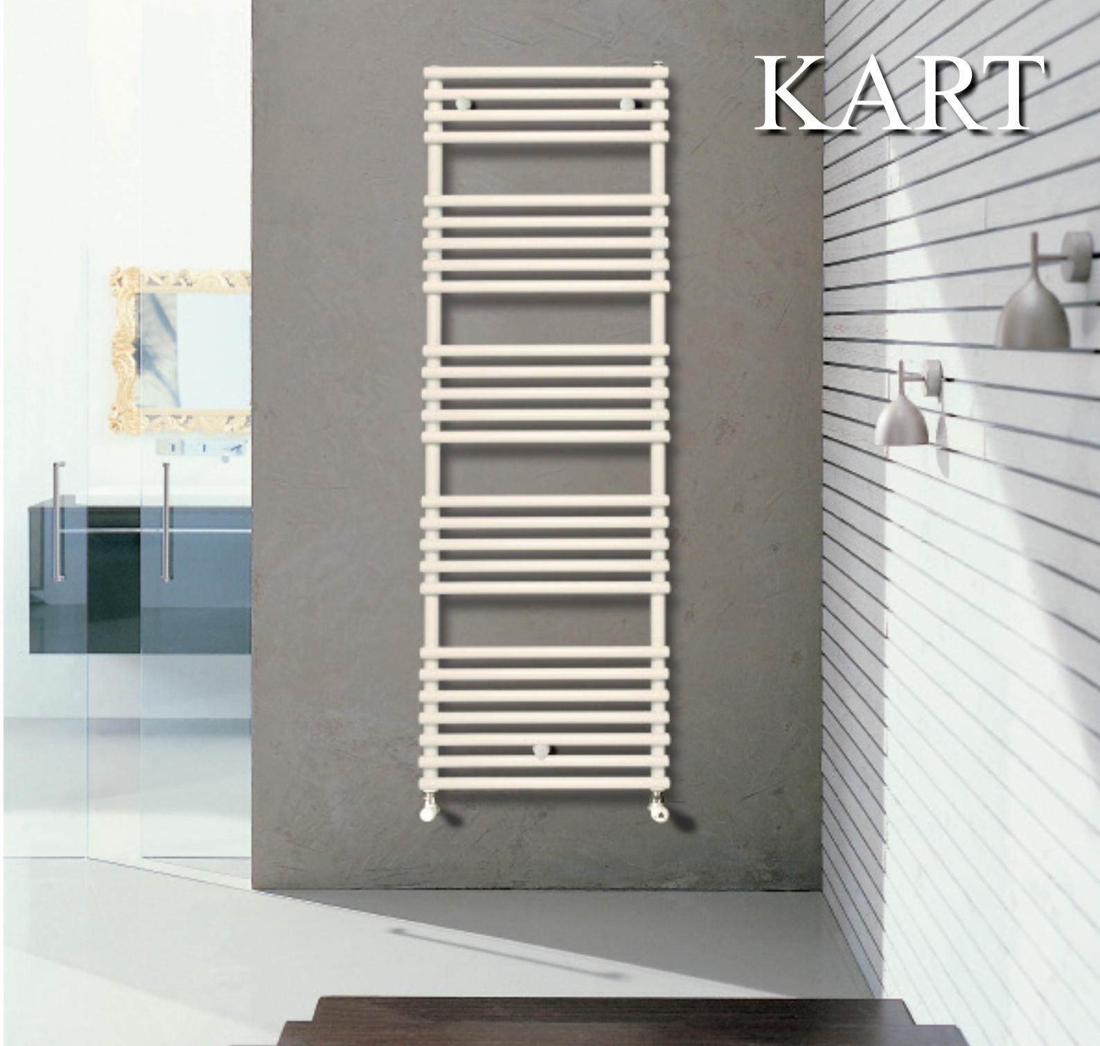
Radiatore verniciato colore Bianco Standard (cod. 01)