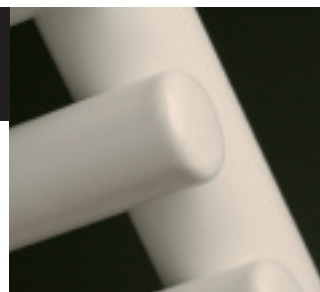
Particolare del collettore e dei tubolari.

La linea di KART è sinonimo di funzionalità e solidità. Grazie alle sue elevate prestazioni è un radiatore adatto a stanze da bagno di grandi dimensioni. Gli ampi spazi tra i tubi scaldanti consentono un perfetto utilizzo come scaldasalviette.